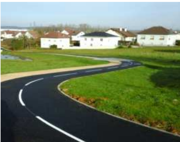
Piste cyclable entre la Véloroute et l'Axone

Une fois n'est pas coutume : c'est une véritable piste cyclable, qui vient d'être mise en service entre la Véloroute et l'Axone. Les piétons ont en effet un itinéraire propre (à gauche sur la photo). Elle est équipée d'une bande de peinture médiane discontinue, qui sera très utile la nuit car il ne manque plus que l'éclairage pour que le tableau soit parfait.