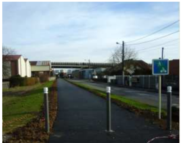
Nouvelle voie verte à Arbouans

VéloCITE demande systématiquement la séparation des flux piétons et cyclistes car leurs vitesses sont incompatibles mais ce n'est pas toujours possible. Ainsi, l'ancienne voie ferrée traversant Arbouans est devenue une voie verte. Attention donc aux week-ends de beau temps où les nombreux piétons rendront la circulation des cyclistes difficile comme sur la Véloroute à Bart. A noter : une bande de peinture médiane est bien prévue, elle va être peinte prochainement.