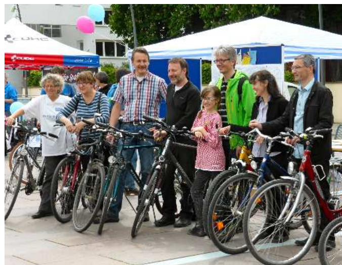
Le 10 mai à Ludwigsburg

La prochaine balade aura lieu le 12 octobre en direction de Bavans et de Voujeaucourt.