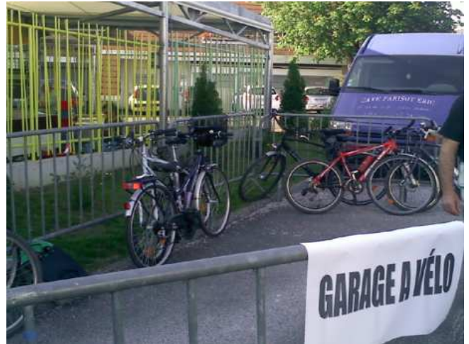
Le garage à notre arrivée.